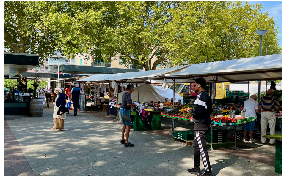
De markt in Prins Alexanderpolder

gebruikt, maar ze hebben niet de tropische producten die ik zoek. Ik ga wel naar de omliggende winkels, daar zit ook een Turkse supermarkt.'