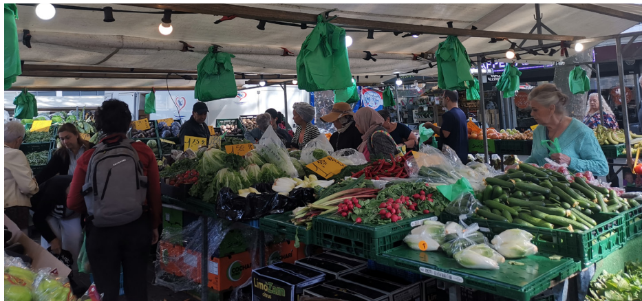
De markt in Prins Alexanderpolder

visboer, Turkse supermarkt, boekwinkel en Zeeman. Aan het plein bevinden zich verschillende horecagelegenheden met twee lunchrooms, een terras met koffie en een visboer met zitgelegenheid. De ruimtelijke inrichting van deze accommodatie verschilt met twee lunchrooms, een terras met koffie en een visboer met zitgelegenheid. De ruimtelijke inrichting van deze accommodatie verschilt met twee lunchrooms, een terras met koffie en een visboer met zitgelegenheid. Mensen kunnen snel een boodschap doen, daarbij opgaan in de anonieme massa, maar er is ook ruimte voor een praatje. Maar het ontwerp van de markt buiten de horecagelegenheid lijkt niet ingericht te zijn op ontmoeting: losse bankjes staan ver van elkaar en van elkaar afgedraaid, ook omdat ze buiten de loop om staan.