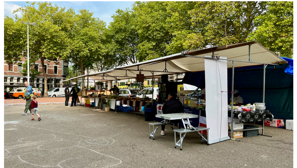
De Kaapse Markt in Katendrecht

Waar op de ene markt nog geen maatregelen zijn genomen om de ontmoetingsfunctie te versterken, is de nieuwe Kaapse Markt al van start gegaan. De Kaapse Markt bevindt zich in Katendrecht, een wijk waar ongeveer 50% van de inwoners een migratieachtergrond heeft, waaronder ook veel mensen met een Europese achtergrond. Voor de opzet van de Kaapse Markt is een adviescommissie opgesteld met inwoners en ondernemers uit de wijk.