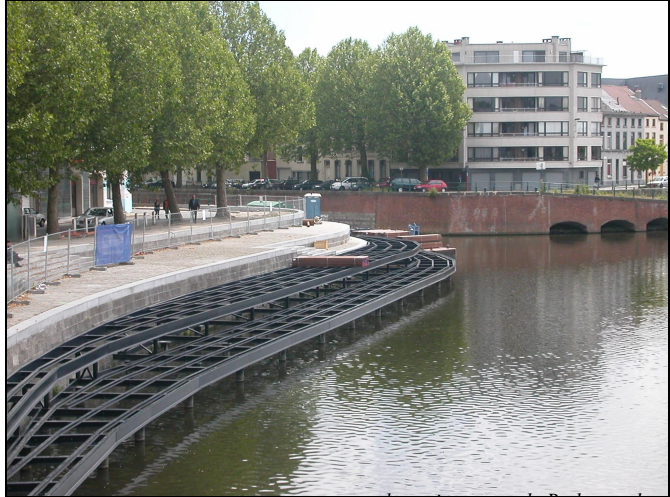
aanlegsteigers aan de Rodetorenkaai

Het Nederscheldeproject, met zijn jachthaven, richt de wijk nog meer op haar watergrenzen. Aan de samenvloeiing van Leie en Schelde worden de waterlopen door de Administratie Waterwegen en Zeewezen van de Vlaamse Gemeenschap en de stad in ere hersteld. De aanlegsteigers aan de Rodetorenkaai en het zicht op het vernieuwde Van Eyckzwembad zullen niet enkel toeristen lokken. Ook de bewoners zullen er op zonnige avonden kunnen genieten van het schouwspel van aanmerende jachten. Bovendien zal de heraangelegde Dampoortstraat als winkel-wandelstraat nog beter uit de verf komen.