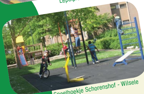
Speelhoekje Schorenschhof - Wilsele