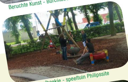
Peuterspeelhoeke - speeltuin Philippsite