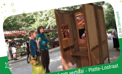
Buurtportretten met een verhaal - Platte-Lostraat