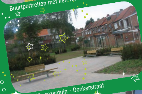
De stille rozentuin - Donkerstraat