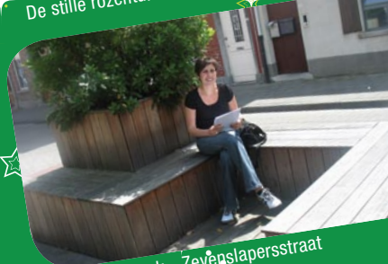
Straatzithoek - Zevenslapersstraat