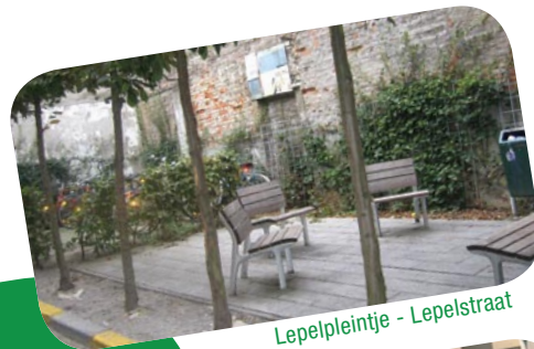
Lepelpleintje - Lepelstraat

Een uitgave van stad Leuven | cel wijkmanagement | i.s.m. met de directie cultuur | Tel 016 27 26 16 www.leuven.be/komopvoorjewijk