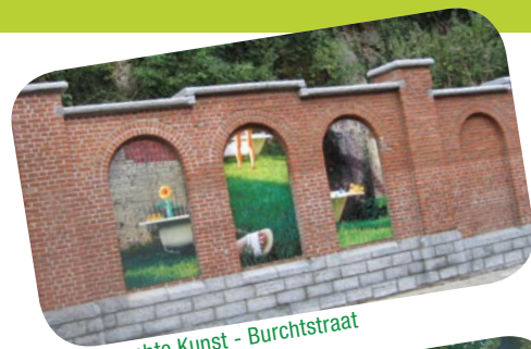
Beruchte Kunst - Burchtstraat