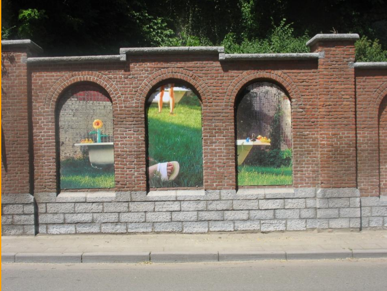
Muurproject Beruchte Kunst Burchtstraat, Leuven