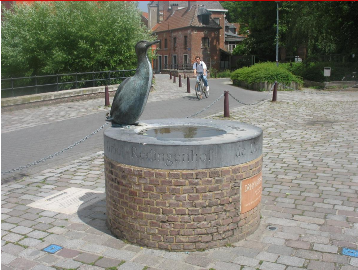
Drinkwaterfontein Geluksbrenger (de Dijle-eend) Redingenhof, Leuven