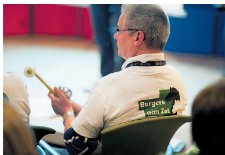
En quizmaster test de wijkkennis in de Stadspolder. „En we houden van?...Stadspolder!”