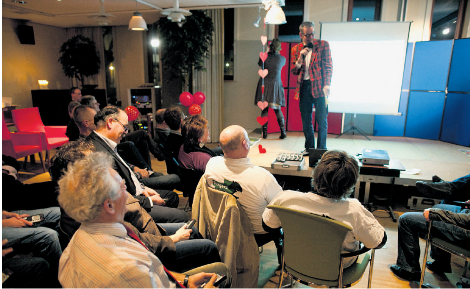
Bewoners van de Dordtse wijk Stadspolder praten in wijkcentrum het Polderwiel over de buurtbegroting.