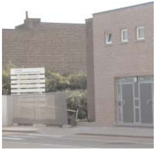
Sociale woningen in aanbouw aan de terminus van tram 21/22

De Stad financiert tevens organisaties (zoals RISO) die de leefbaarheid in deze wijk willen verbeteren. Zo plant RISO in 2005 vormingsessies voor sociale huurders om een beter inzicht in de eigen positie te verwerven en hun kennis omtrent sociale huurderkwesities te versterken.