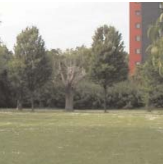
Groene ruimte tussen de hoogbouw

Wil je meer weten over Nieuw Gent - Steenakker? Wil je meedenken over de sterke kanten en de knelpunten van je wijk? Wil je meepraten over maatregelen en werkpunten voor je wijk? Dan is deze nota iets voor jou!