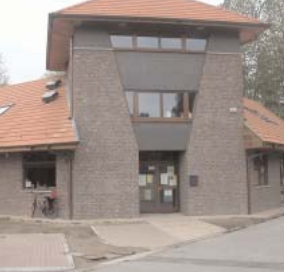
Het nieuwe Jongeren Ontmoetings Centrum (JOC)