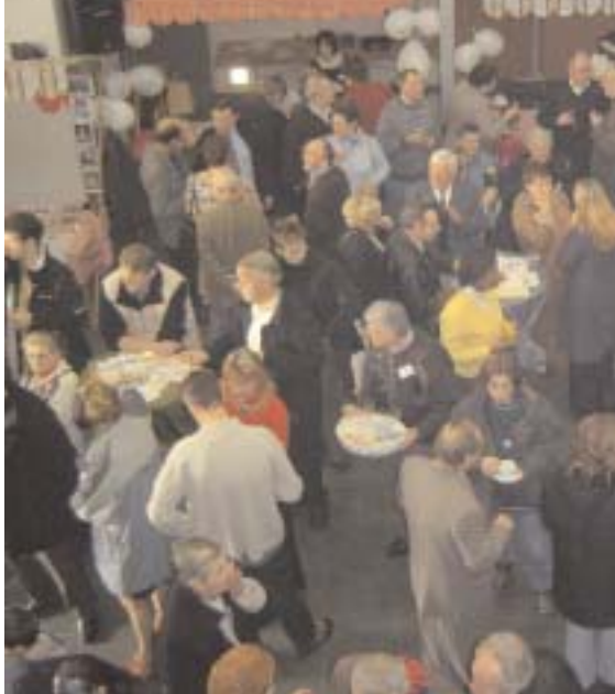
Nieuwjaarsreceptie in het Welzijnsbureau

In de wijk leven veel mensen samen op een beperkte oppervlakte. Bovendien blijven velen maar voor korte duur wonen in de hoogbouw, waardoor buren elkaar minder goed kennen.