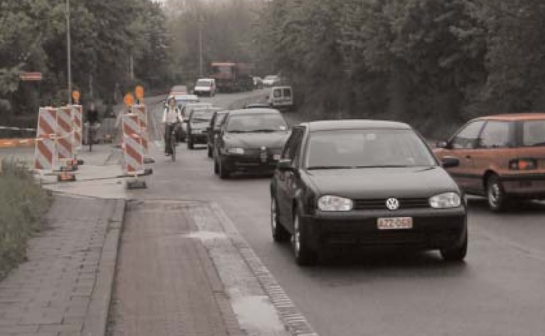
Gevaarlijke verkeerssituatie aan de Zwijnaardebrug