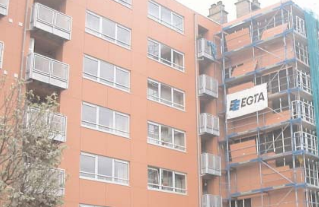
Renovatie van het appartementsgebouw Vermeyleylen