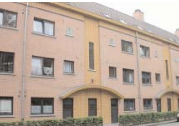
Gerenoveerde sociale woningen in de Steenakkerstraat