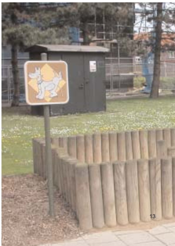
Hondentoiletten aan de Edelsteenstraat

Al enkele jaren levert de Groendienst inspanningen om het openbaar groen natuurvriendelijker te beheren. In Nieuw Gent geeft dat nu een mooi resultaat.