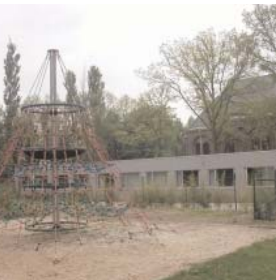
Kinder- en jongerenwerking 't Leebeekje