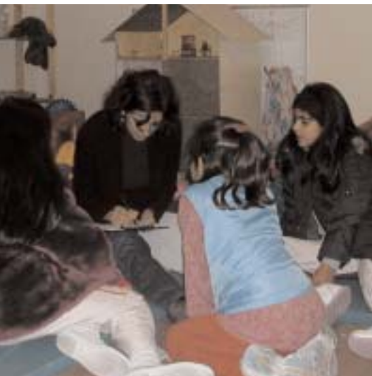
Gebiedsgerichte Werking luistert naar de mening van kinderen uit de wijk

Voor je ligt de nota van de Bloemekenswijk. Dit is ons vertrekpunt om met jou als bewoner, gebruiker, handelaar, bedrijf en organisatie, het gesprek aan te gaan over jouw wijk. We willen samenwerken om te komen tot een volwaardig wijkprogramma. Dat programma zet in grote lijnen uiteen hoe de wijk de komende vijf jaar zal veranderen.