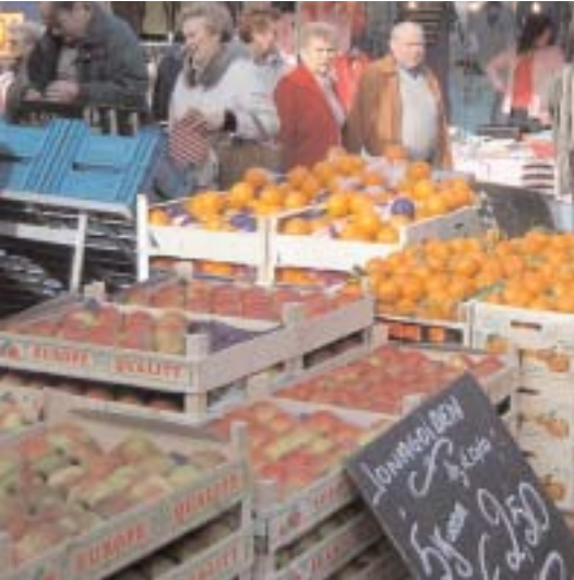
De markt van het Van Beverenplein

De Bloemekenswijk telt een 30-tal buurtwinkels en twee vestigingen van grote warenhuisketens aangepast aan ieders beurs. Door dit ruime aanbod aan winkels is de zone Van Ryhovelaan – Maisstraat één van de acht kleinschalige handelsgebieden die Gent kent. Ook aan de Brugse Vaart vinden we eveneens enkele vestigingen van grote ketens terug. Dit aanbod voldoet aan de noden van de wijk. Wat niet langer voldoet, is het aanbod aan gespecialiseerde handelszaken : zij trekken weg uit de wijk.