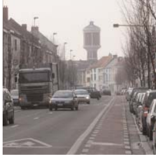
Frans Van Ryhovelaan

Verbindingskanaal. Op die manier ontstaat er een extra verbinding met het stadscentrum en wordt de Bloemekenswijk beter ontsloten voor de fietsers. Het voormalige treinspoor- Westerring werd omgevormd tot groenzone/fietsas en verbindt de wijk ten westen met de Brugse Poort en ten oosten met Muide-Meulestede. Het Westerringspoor zal eveneens aansluiten op de fietserbrug.