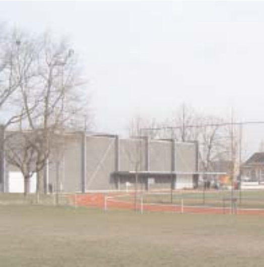
Jan Yoens, ook wel gekend als DRACUNA

Eén op vier wijkbewoners is jonger dan 20 jaar. Tot over enkele jaren stond het vrijetijdsaanbod voor deze leeftijdsgroep niet in verhouding tot haar omvang. In 2002 kwam hierin verandering doordat op de plaats waar vroeger het openluchtzwembad Jan Yoens gelegen was, Dracuna verrees. Dit is een sportvloer met bijhorende materiaalruimtes en een viertal jeugdlokalen. Na een moeizame start draait de multifunctionele sportzaal sinds kort op volle toeren. Ook het terrein en de speeltuin rondom de sportschuur is dé uitvalsbasis voor de kinderen uit de buurt geworden.